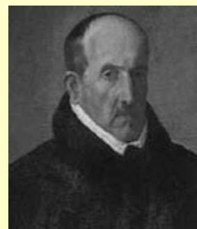
Retrato de Luis de Góngora , por Velázquez (Museo Lázaro Galdiano, Madrid).

En esta época, todo podía ser material poético , desde una fiesta hasta un aspecto filosófico.